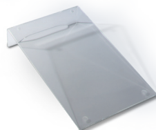
Supporto in plexiglass

SPOT è il nuovo registratore di cassa prodotto e omologato da MCT - Money Control Technologies srl.