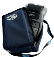
Borsa da trasporto per versione ambulante